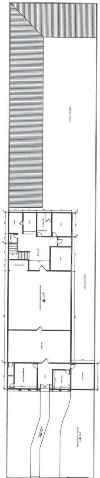
PLANTA BAIXA - PISO SUPERIOR ESCALA