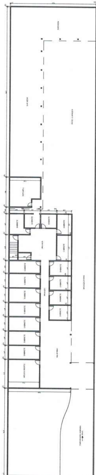
PLANTA BAIXA - PISO SUPERIOR ESCALA