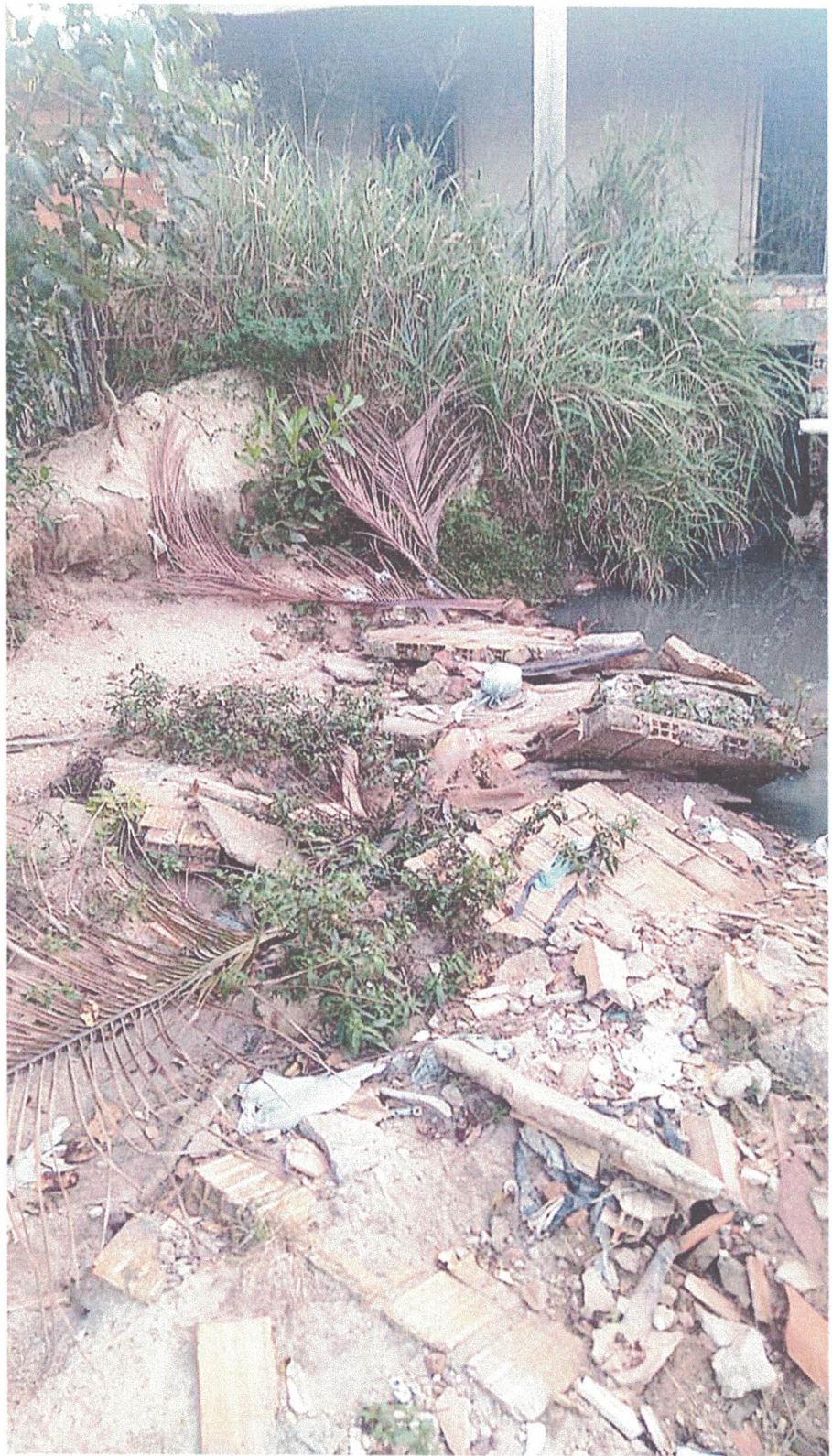
FOTO 4 - LATERAL DIREITA DA GALERIA TOTALMENTE DESTRUÍDA EFEITO: ASSOREAMENTO, INCLUSIVE SÁ PUXANDO DOS QUINTAIS VIZINHOS.